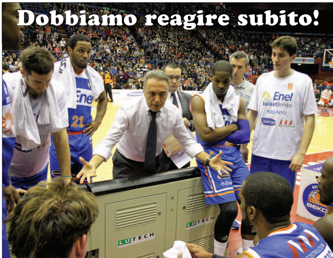
Un time out dell'Enel durante il match nel Forum di Assago con l'EA7

BRINDISI-ROMA IN DIRETTA SU RAISPORT 1 ALLE ORE 20.30